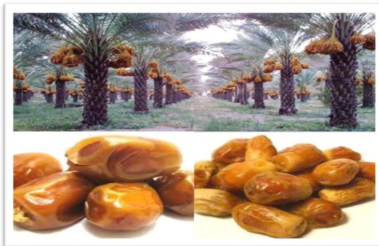
شكل 1: نخيل الزهدي قبل جنيها، وتمر صنف الزهدي

ويعد التمر من العناصر الزراعية الأساسية التي ساهمت في ازدهار الاقتصاد المحلي في العراق، إذ يعد العراق من الدول الأولى والمتقدمة في إنتاج التمور وتصديرها خارجياً لسد حاجة الأسواق العالمية من المنتج. وتوجد الكثير من أصناف التمور العراقية منها (الساير، البرحي، المكنوم، الزهدي)، يعد صنف الزهدي من أكثر أصناف التمور العراقية إنتاجاً ويستهلك على قسمين القسم الأول للاستهلاك المباشر أما القسم الثاني فيذهب إلى الصناعات المختلفة القائمة على التمور ومنها السكر السائل، الدبس، الخ وذلك لتمييز صنف الزهدي العراقي بمزايا جيدة جدا ومن أهمها كمية السكر الموجودة فيه إضافة إلى ذلك يتميز صنف الزهدي بأنه يعد من الأصناف النصف الجافة وكذلك يتحمل فترات خزن طويلة، وكذلك تتميز نخلة الزهدي بإنتاجها العالي والذي يتراوح ما بين 90 إلى 130 كلغم.