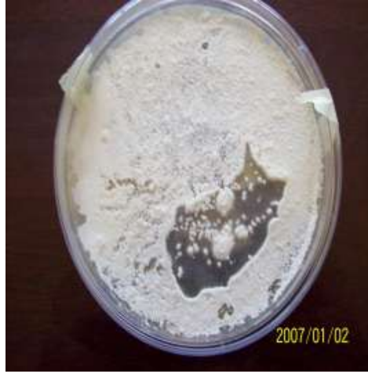
شكل ( 1). مستعمرة الفطر Beauveria bassiana بعد خلطه مع مسحوق الغسيل نلاحظ نمو المستعمرة الفطرية وعدم تأثرها بمسحوق الغسيل (10x).