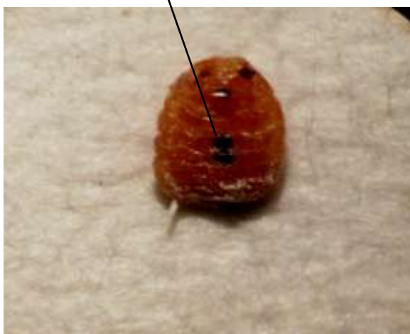
الشكل (2) . حوريات بق الحمضيات الدقيقي Planococcus citri مصابة بعد معاملتها بخليط الفطر Beauveria bassiana ومسحوق الغسيل والزيت الصيفي (x10) .