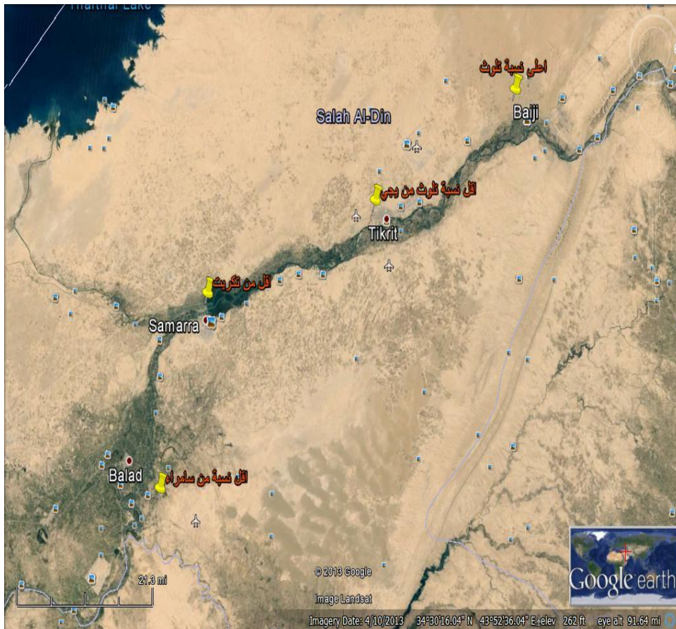
شكل (1) صورة توضح مناطق الدراسة

C_a تركيز الرادون في الحيز الهوائي بوحدة Bq.m^{-3} .