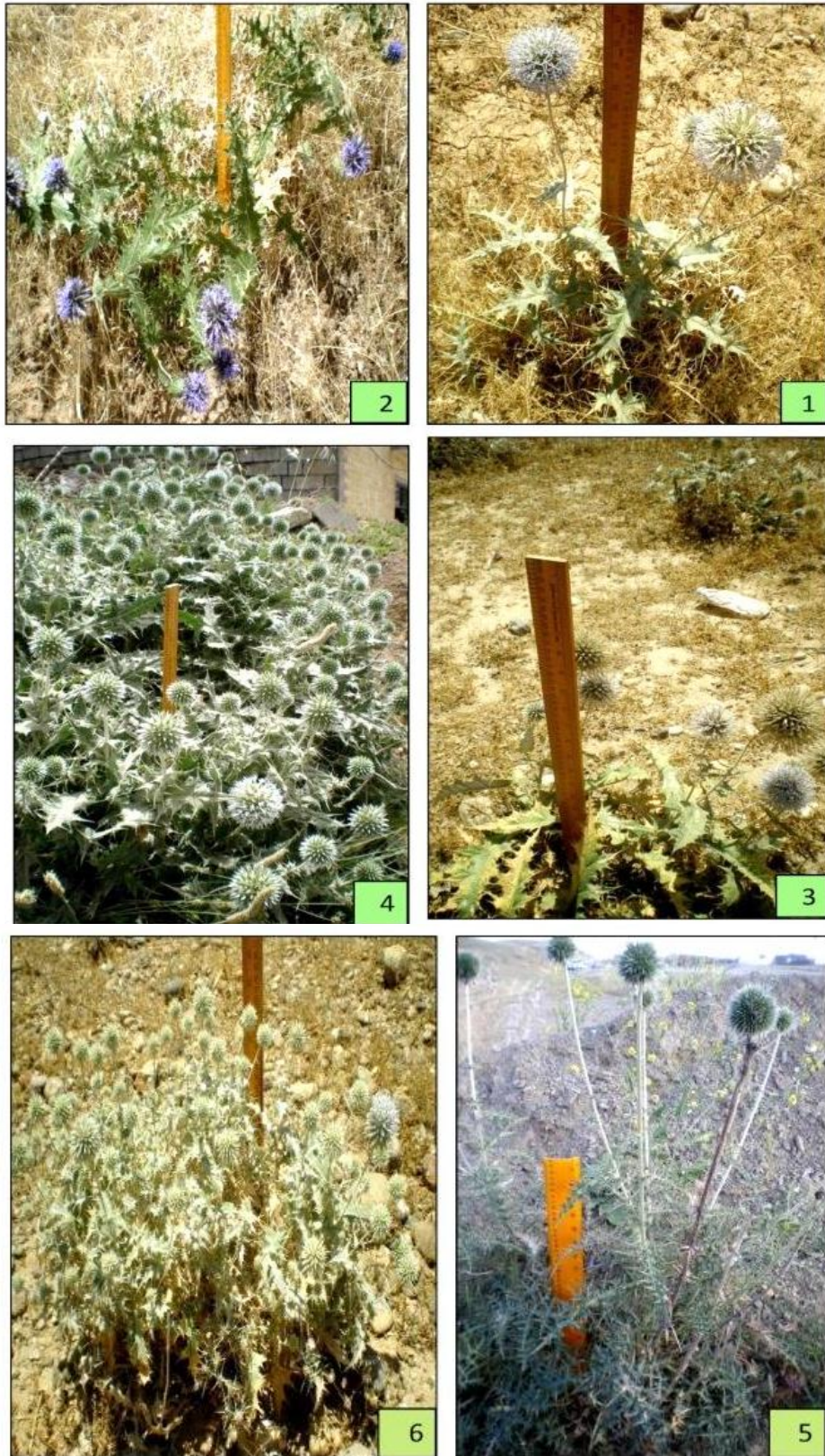
الشكل 2- صور لأنواع الجنس Echinops