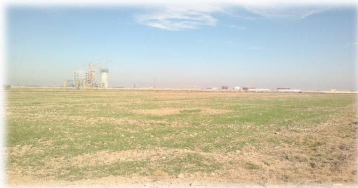
شكل رقم (4) الاراضي التي سيتم التوسع على حسابها.