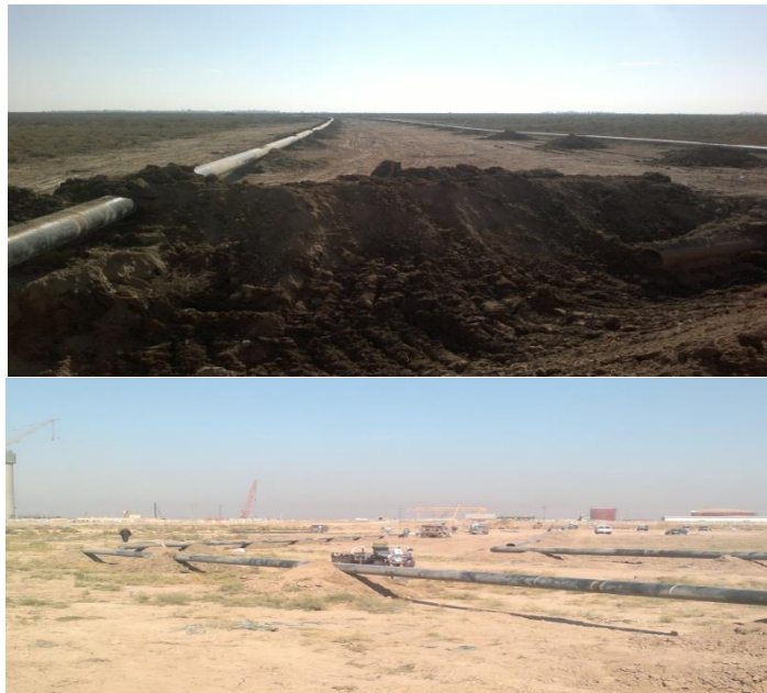
شكل رقم (3) الانبوب الناقل للنفط من حقل الأحذب الى المحطة

وحيث أن الارض مسطحة فإن كل المشاهد الموجودة سوف تتأثر بقوة بمحطة القوى، ولكن اذا أخذنا في الاعتبار أن المنطقة اساسا هي منطقة زراعية فان التداخل البصري للمحطة سوف يكون عاليا كما ان المحطة ستنزود بالنفط الخام من حقل الأحذب الواقع جنوبها بمسافة 70 كلم وقد تطلب مد الانبوب ان يمر بمناطق زراعية غنية على امتداد المسافة مع محرم بعرض 50 متر على جانبي الخط وهو بالتأكيد سيشكل تداخلا بصريا عاليا ويشكل خسارة اقتصادية كبيرة وكان بالامكان ان يتم مد الانبوب على امتداد الشارع العام الرابط قضاء الصويرة مع قضاء النعمانية والذي يمتلك محرما بعرض 200 متر (23) . شكل رقم(3)