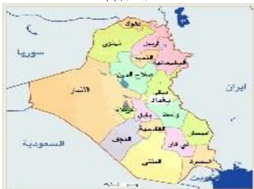
خريطة رقم (1)