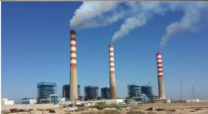
شكل رقم (1) أبراج محطة الزبيدية الكهربائية (أحد الأبراج مزدوج)