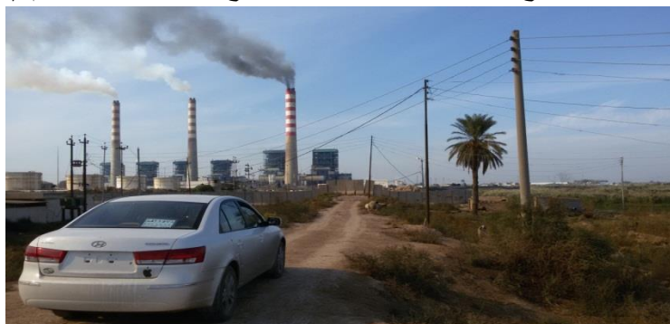
شكل رقم (1) الانبعاثات الغازية من مداخن المحطة

ومن خلال التقييم الذي قمنا به من خلال بيانات الشركة الصينية لمعدلات الانبعاث التي من المتوقع انبعاثها بعد تشغيل المحطة، ان التركيزات القصوى للمستوى الارضي لثاني اوكسيد الكربون لمتوسط 24 ساعة (126,7 ميكروجرام / متر) الملوث الرئيسي الناتج من المحطة في حالة حرق النفط كوقود يتوقع حدوثها على بعد حوالي 1000 متر جنوبي النقطة المتوسطة للمداخن الثلاث لمشروع المحطة للمداخن الثلاث لمشروع المحطة للمداخن الثلاث لمشروع المحطة (19) . شكل رقم (1)