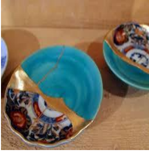
انموذج (4) صحن خزفي ، اعيدت بتوظيف التقنيات الثلاث

صحن خزفي ، قطره (25سم) ، كسر ، وفقدت اجزاء منه ، تم اصلاحه بالتقنيات الثلاث معاً ، اضافة الذهب على طول المناطق المراد إصلاحها ، ثم عالج الجزء المفقود بالذهب ، و اضاف أجزاء من الخزف ، قطع مختلفة وغير ذات صلة في المنطقة المكسورة ( المفقودة ) مع مراعات الحفاظ على تصميم شكل وملس القطعة الاصيلي ، فيكون الناتج كياناً جديداً من قطع العمل الاصيلي وأخرى جديدة ولفها معا بمهارة وهو يوظف ادواته من لون وتقنية ومهارة يدوية ودافع فكري يجعله حريصاً على انقاذ المكسور وتعويض المفقود ، وربط الكل الاصيلي والجديد ككل