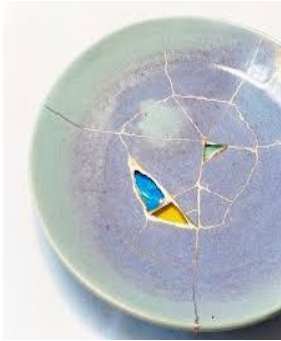
انموذج (3) صحن خزفي اعيدت بتقنية

صحن خزفي ، قطره (25سم) ، كسر ، وفقدت اجزاء منه ، تم اصلاحه بتقنية ( yobitsugi ) حيث يتم لصق أجزاء من قطع سيراميك مختلفة الأشكال والألوان (غير ذات صلة) في المنطقة المكسورة (التي فقدت قطعها) ، وقد حافظت على بنية الشكل الاصيلي ، مؤكدا ان الكيان الجديد الذي انجز بضافة قطع جديدة الى الاصل انما هو ضاغط يحرك الخزاف للحفاظ على ارتباطه بالقطع وهو يجدد رؤيته الجمالية بالاكْتفاء بعدم الاكْتمال مع ايمانه بالتغير المستمر الذي يطال كل شيء كعلامة من علامات الوجود بتبدل الحال وضرورة قبول الاخر كما هو بكل ما به من عيوب في فلسفة جمالية انشأها اليابان بدافع واقع بيئته الصعب والتحديات التي يواجهها ، كان لزاماً عليه أن يكسر المألوف ويزيح الثابت ليرى الجمال بعين بيئته كما هو بكل ما به من عيوب افرزت جمال عدم الاكْتمال .