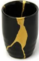
انموذج (2) انية فخارية ، ابعادها ( 20×30سم )

أنية خزفية بفوهة كبيرة ، أبعادها ( 20×30سم ) ، مشكلة بالعجلة الدوارة ، كسرت ، وفقدت اجزاء منها ، تم اعادتها بتقنية ( makienaoishi ) بمعالجة الجزء المفقود بالذهب و الايوكوسي بطريقة تزيينه مع مراعاة الحفاظ على تصميم شكل القطعة وملمسها الاصيلي ، وهو يرى جمالها بالحفاظ على طبيعتها ، مع ما بها من عيوب ، وظهورها بمظهر من عدم الكمال يعود بمرجعياته الى بوذا وعلامات الوجود من تبدل الحال المستمر وغياب الطابع الذاتي ، فهو يسعى إلى حفظ الرباط العاطفي وتقبل الاخر اذا ما مرتقلبات الايام وتبدلات الوجود المستمر ، حتى وأن كان فقدان جزءاً منها ، كفعل ساري على الوجود يقبله كل من بالوجود ويرى من خلاله الجمال في عدم الكمال .