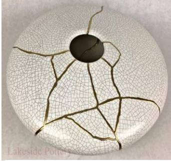
انموذج (1) فازه منبسطة بيضاء ، اعدت بتقنة ( kintsuai )

انية فخارية ارتفاعها (15سم ) منبسطة ، بفوهة صغيرة في المنتصف ، يغطي سطحها زجاج ذو معامل تمدد عالي يظهر تكسر طبقة الزجاج ، تم اعادتها بتقنية ( kintsugi ) بإضافة الذهب على طول المناطق المكسورة المراد اصلاحها ، و هو هذا يعيد انتاجها بنظام شكل جديد ازاح القديم وخلق كيانا جديداً يخترن في دلالاته حضور العمل في حياة التلقي و تواصله ، و قدرة الفنان في توظيف الطارئ المتبدل ، و رؤية الجمال في كل شيء ، بل هي تكتفي بعدم الاكتمال مفهوم للجمال وما زرعته فلسفة ( wabi-sabi ) من تقبل الأشياء على ما هي عليه بشوائبها و بتكسراتها ، و هو يعزز العلاقة الحميمة و العرفان لما قدمت القطعة من خدمة لا تنتهي ، بل اعاد انتاجها برؤية جديدة محتفظة بخدمتها ، و حضورها العاطفي .