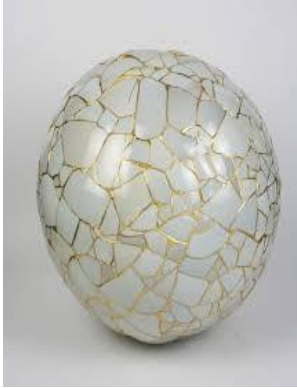
انموذج (5) كرة خزفية اعيدت بتقنية ( kintsugi )

كرة خزفية ، قطرها (25سم) ، كسرت ، وتم اعادتها بتقنية ( ) kintsugi بضافة الذهب على طول المناطق المكسورة اذ جمعت لتأخذ الشكل الكروي ، فقد اعيد انتاجها ككيان جديد يخترن في دلالاته حضور العمل في حياة التلقي وتواصلها وتقبل التبدل والتغيير ، ويرى الجمال في كل الاشكال وأن لم يكتمل الشكل الأول وهو مفهوم الجمال كما تراه فلسفة ( wabi-sabi ) تقبل الاشياء على ما هي عليه و الوفاء والعرفان لما قدمت القطعة من خدمة ، بل اعاد انتاجها برؤية جديدة محتفظة بحضورها العاطفي .