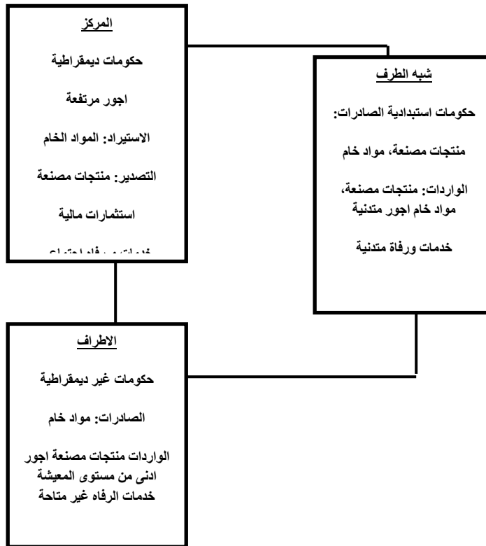
الشكل (2) العلاقات بين دول المركز، المحيط، شبه المحيط ضمن الاقتصاد العالمي

المصدر: جون بيليس وستيف سميث، عولمة السياسة العالمية، (دبي، مركز الخليج للابحاث)، ط1، 2004، ص280.