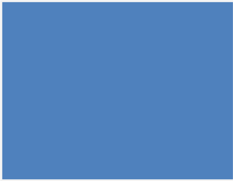
(ب) تضاعف الأفرع الخضريّة على وسط MS المجهز بـ 5% كلوكوز + 5 ملغم/لتر BA .