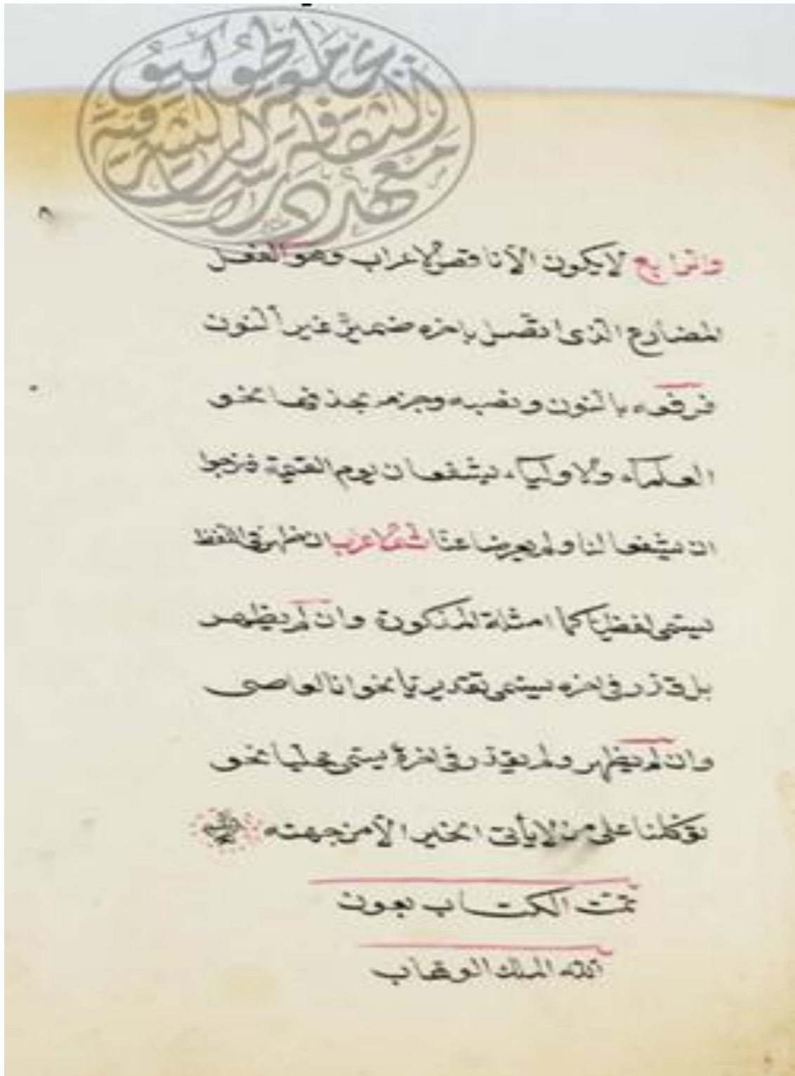
الصفحة الأخيرة من نسخة ( ب )