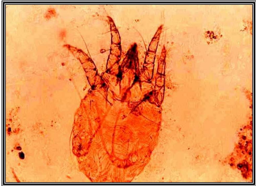
صورة (1) : حلم الجرب جنس Psoroptis spp.

اوضحت الدراسة ان اعلى نسبة للأصابة بحلم الجرب كانت في نيسان 37.5 % وهذا ماجاء مطابقا لما ذكره (15) واختلفت مع ماتوصل اليه (7) والذي فسر الأرتفاع الشتوي للأصابة بعلاقتة بانخفاض درجة الحرارة وارتفاع مناسيب الأمطار .