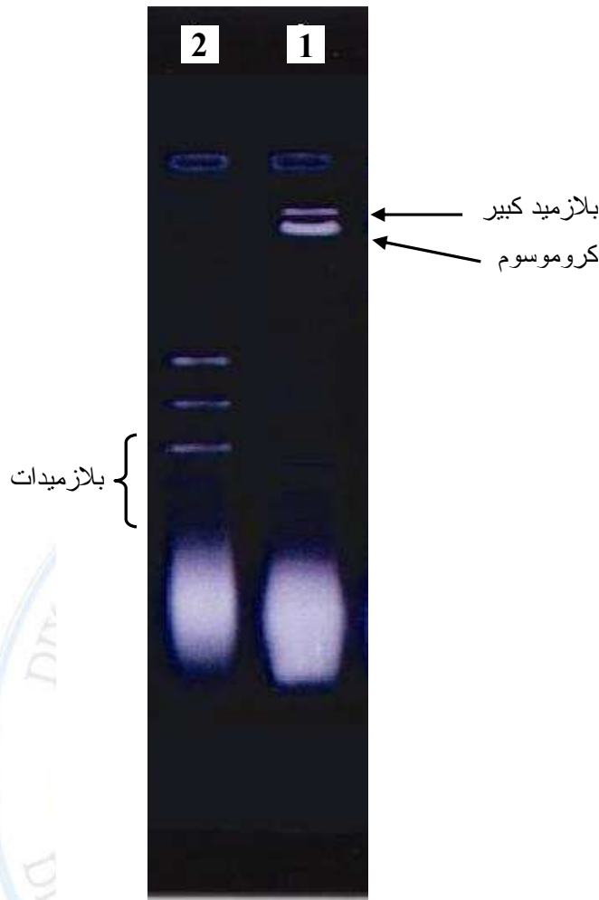
شكل (2) المحتوى البلازميدي المعزول من بكتريا Pseudomonas و E. coli

العمود (1): المحتوى البلازميدي لبكتريا Pseudomonas spp.