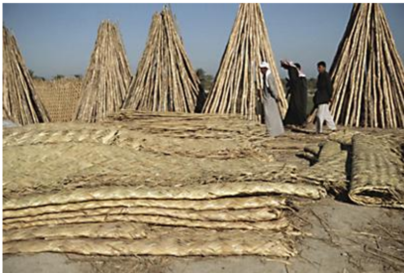
استخدام تقنيات البناء المحلية في منطقة الاهوار