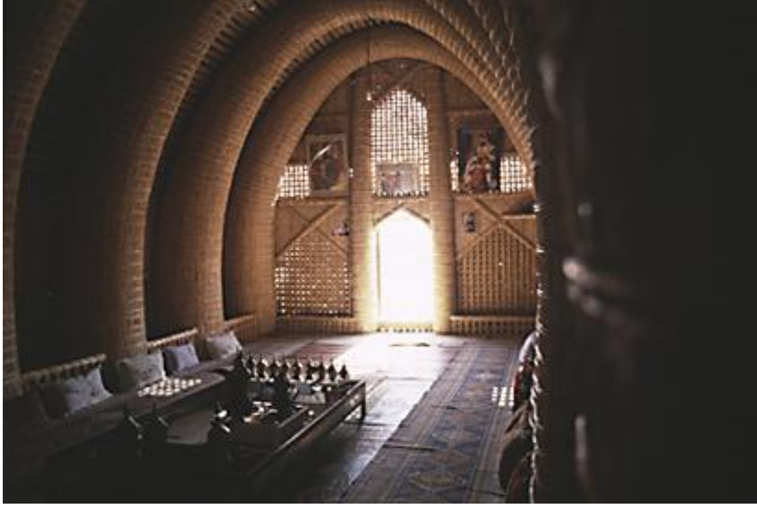
نموذج لاستخدام مواد البناء المحلية ( القصب والبردي ) في الاهوار

ومن مواد البناء المحلية الاخرى التي شاع استخدامها في بلاد الرافدين هو استخدام القصب والبردي باعتبارها عناصر بنائية مكونة للوحدات السكنية في منطقة الاهوار التي تقع جنوب العراق .