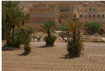
استخدام الطين المجفف في البناء في العمارة اليمنية

لقد تم استخدام مواد البناء التي تساعد على حفظ الحرارة ومنع تأثير اشعة الشمس والعزل الحراري ، ويعتبر الطين المجفف افضل مادة طبيعية يمكنها توفير العزل الحراري للمبنى ، لذلك استعمل على نطاق واسع في حضارات بلاد الرافدين ومصر واستعمله الرومان وشعوب الشرق الاوسط ، وكان اول المباني الاسلامية التي اقيمت بالطين المجفف المسجد النبوي بالمدينة المنورة ، كما اقيمت المنازل في مكة والمدينة من الطين المجفف وغطيت بالقباب . 18