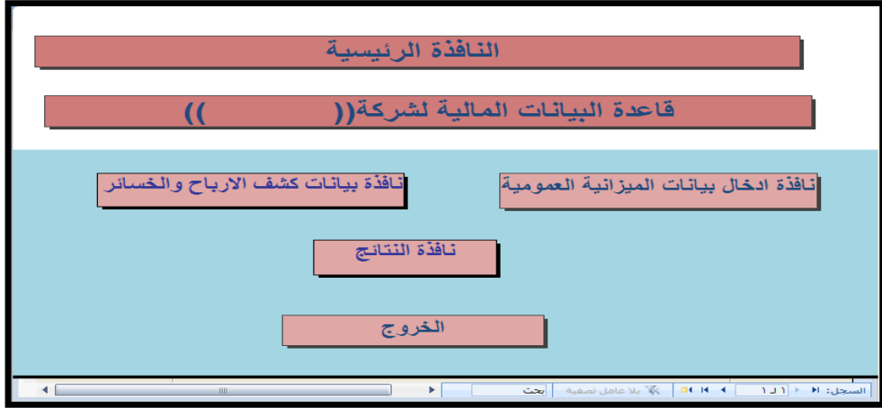
الشكل (3) النافذة الرئيسية للنظام

توفر النافذة الرئيسية (الشكل 3) الدخول الى النوافذ الفرعية للنظام و التي يمكن من خلالها ادخال البيانات، واستعراض النتائج والاطلاع على الكشوفات والتقارير التي يوفرها النظام.