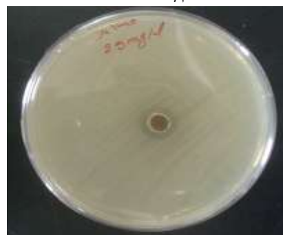
شكل 4. بكتريا Salmonella spp. عند التركيز 25 ملغم/مل من المستخلص

aeruginosa اقل نسبياً مقارنة بالبكتريا الموجبة لصبغة غرام ( Staphylococcus aureus, Bacillus spp. ) في التراكيز الواطئة. وهذا يتفق مع ما وجدته Edziri وآخرون (9) و Hayet وآخرون (12) لمستخلصات الحرمل بالكولوروفورم والميثانول. فقد بلغ قطر المنطقة الشفافة الناتجة من تثبيط بكتريا E. coli عند التركيز 25 ملغم/مل من المستخلص المائي لبذور الحرمل هو 7 ملم كما في الشكل (1)، وأعلى تثبيط تم الحصول عليه عند التركيز 300 ملغم/مل إذ بلغ قطر المنطقة الشفافة 13 ملم. أما بكتريا Pseudomonas aeruginosa فقد اظهرت مقاومتها للتركيزين 25، 50 ملغم/مل، في حين بلغ قطر المنطقة الشفافة عند التركيز 100 ملغم/مل 18 ملم كما في الشكل (3) وازداد بزيادة التركيز حتى بلغ مقدار التثبيط 22 ملم بتركيز 400 ملغم/مل. بينما اظهرت بكتريا Salmonella حساسيتها للمستخلص المائي لنبات لحرمل بتركيز 25 ملغم/مل، إذ بلغ قطر المنطقة الشفافة 6 ملم كما في الشكل (4) وازداد القطر بزيادة التركيز ليصل أعلى مستوى له (15 ملم) بتركيز 350 ملغم/مل.