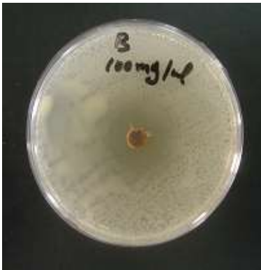
شكل 6. بكتريا Bacillus spp. عند التركيز 100 ملغم/مل من المستخلص

اللونية الدقيقة، وجد Takaisi-Klkuni و Schilcher (30) بان مستخلص العكبر (propolis) بالايثانول يتداخل مع الانقسامات الخلوية لبكتريا Streptococcus من خلال تكوين عدة خلايا كاذبة او تشويش السايبتولازم او تثبيط تصنيع البروتين الذي تقود الى تحلل البكتريا، كما اكد (19) بان مستخلص العكبر وبعض المكونات الفينولية تؤثر على حالة الطاقة الحيوية لغشاء الخلية بتثبيط امكانياته مما يقود الى زيادة نفاذيته للأيونات وتعويق البكتريا. فاحتمال ان تكون مثل تلك الميكانيكيات هي السبب وراء تثبيط نمو أجناس البكتريا قيد الدراسة بالمستخلص المائي لبذور الحرمل. لوحظ ان تأثير المستخلص المائي لبذور الحرمل في أنواع البكتريا السالبة لصبغة كرام كان متباينا اذ كانت بكتريا Pseudomonas aeruginosa هي الأكثر تأثرا تليها بكتريا Salmonella spp. ثم E. coli أما بالنسبة للبكتريا الموجبة لصبغة كرام فقد كانت بكتريا Staphylococcus aureus أكثر تأثرا من بكتريا Bacillus spp. بالفعالية التثبيطية للمستخلص المائي لبذور الحرمل. ان المنطقة الشفافة للتثبيط ازدادت مع زيادة تراكيز المستخلص، وهذا ربما يعود الى زيادة مستويات القلويدات الأساسية التي لها القابلية على ان تقحم نفسها مع DNA الاحياء المجهرية مؤدية إلى قتلها (5). كما أشارت الدراسات بان مشتقات ألبيتا كاربولين تثبط أنزيمات DNA-isomerases وتدخل في تصنيع الـ DNA إذ تتداخل هذه المشتقات مع الـ DNA عبر كل من الارتباط بالأحدود (groove binding) والأنماط الاقترامية (intercalative modes) مسببة تغييرات هيكلية رئيسية في الـ DNA (29).