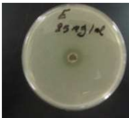
شكل 1. بكتريا E.Coli عند التركيز 25 ملغم/مل من المستخلص المائي للحرمل