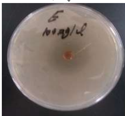
شكل 2. بكتريا E.coli عند التركيز 100 ملغم/مل من مستخلص الحرمل