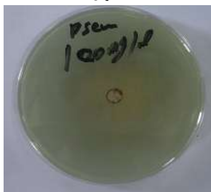
شكل 3. بكتريا Pseudomonas aeruginosa عند التركيز 100 ملغم/مل من المستخلص