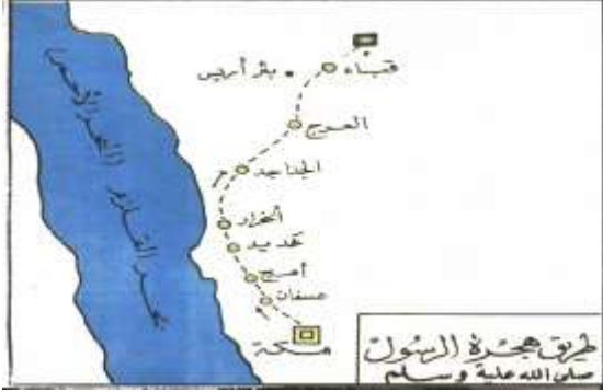
شكل رقم (2)